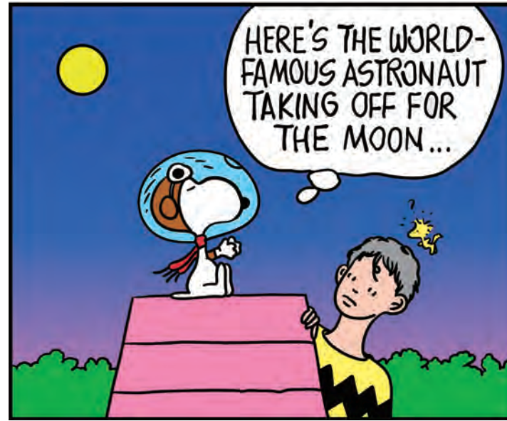
신모래 Shin Morae | What are you Thinking About?, 2019 190 x 140cm, Digital print