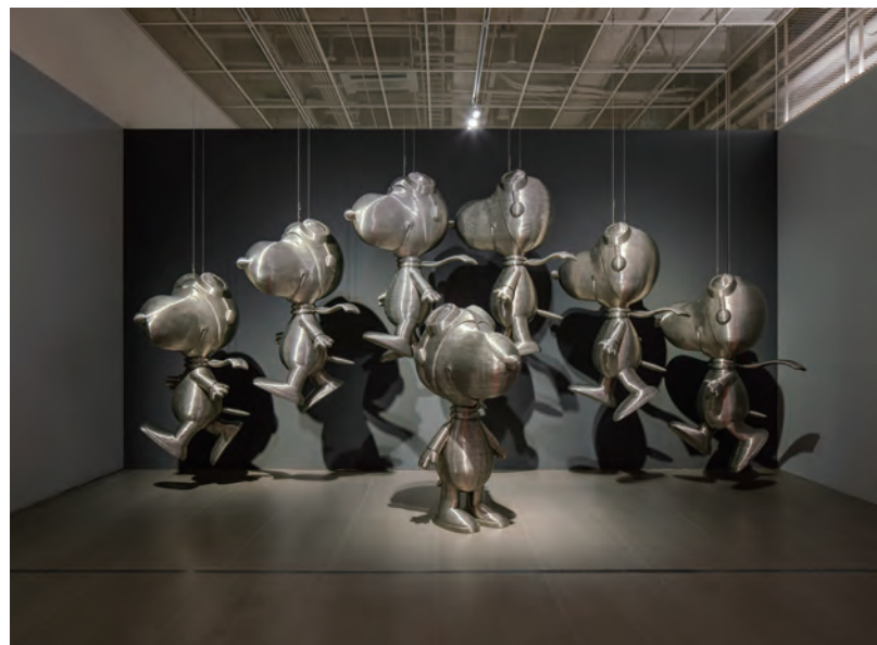
박승모 Park Seungmo | Maya, 2019 Displayed dimension, Variable, Aluminum wire and fiberglass