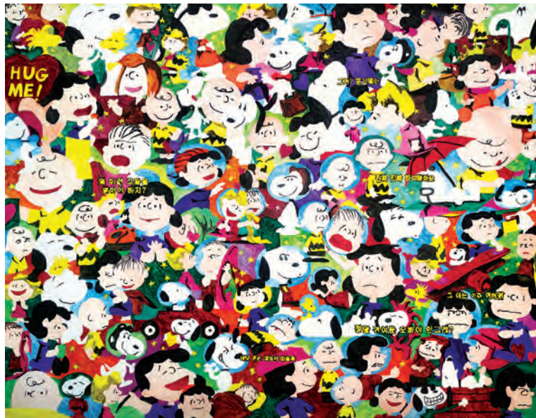
노상호 Noh Sangho | The Great Chapbook 2 - Snoopy, 2019 91 x 116cm, Oil on canvas