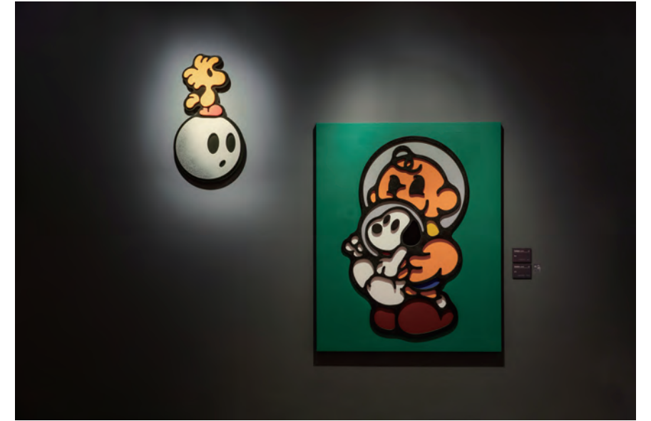
샘바이펜 Sambypen | Moon, 2019, 50.7 x 91.7cm, Spray paint on wooden panel Earth, 2019, 130.3 x 102.2cm, Spray paint on wood and canvas