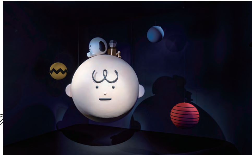
스티키몬스터랩 Sticky Monster Lab | Peanuts in the SML System, 2019 Displayed dimension variable Charlie H150cm, Paint and resin on FRP